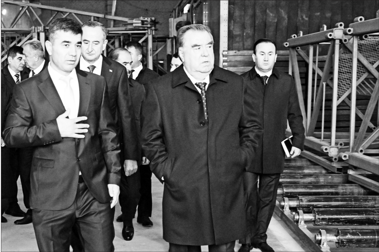
(Идома аз саҳ. 1)

Зимни шиносӣ бо раванди истеҳсолот ба Сарвари давлат муҳтарам Эмомалӣ Раҳмон иттилоъ доданд, ки фаъолияти корхонаи нави санаоти дар се баст ба роҳ монда шуда, дар он асосан истеҳсоли гачкартон ва гуррагачҳои сохтмонӣ роҳандозӣ шудааст.