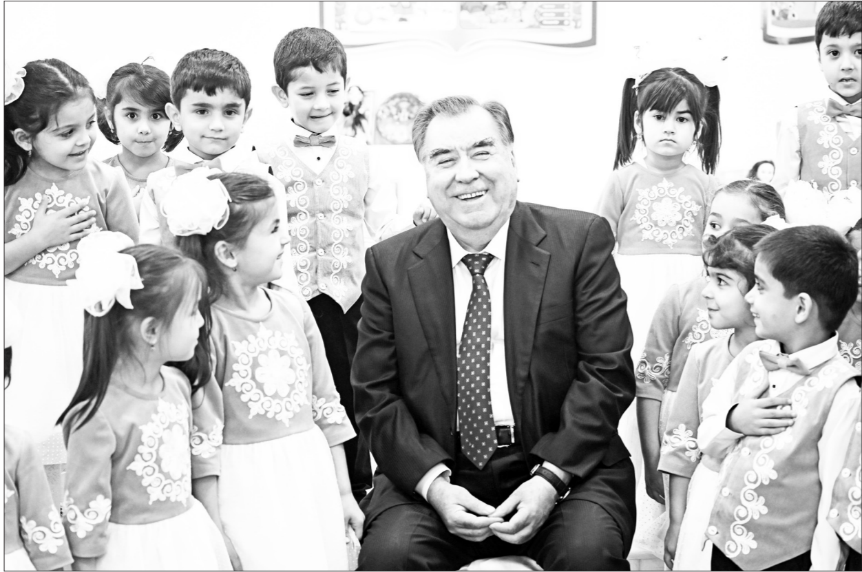
(Идома аз саҳ. 2)

Ба Пешвои миллат мухтарам Эмомалӣ Раҳмон иттилоъ доданд, ки корхонаи истеҳсоли воситаҳои нақлиёти барқӣ дар масоҳати 15 ҳазору 325 метри мураббаъ бунёд шудааст.