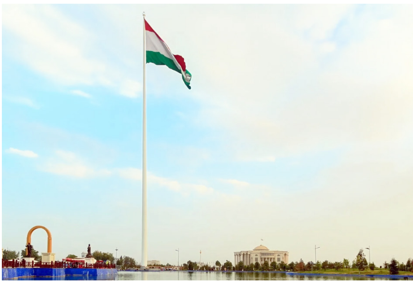
Давлат САФАР, Шоири халқии Тоҷикистон