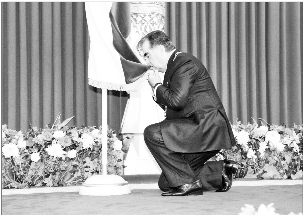
(Идома аз саҳ. 1)

Чашноқи Наврӯз, Чилла (Ялдо), Меҳргон ва соири чашноқи ориёӣ ва ривоятҳои миллию мардумии ориёӣ дар кишварҳои форсизабон ва дар ҷаҳон дар ҳоли фаромӯшӣ буданд. Ин талаш ва иқдомҳои ҷаноби Эмомалӣ Раҳмон буд, ки аз ҷумла чашноқи Наврӯз ва Чилла аҳамияти ҷаҳонӣ пайдо карда, мӯҷибаи эҷоби чашни Меҳргон ва дигар чашноқи