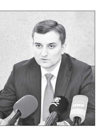
С. СУННАТӢ, «Садон мардум»

Мувофиқи таҳлилҳои соли 2024 ҳаҷми воридоти доруворӣ ба ҷумҳурий дар муқоиса бо соли қаблӣ 420,3 тонна ё 2,7 дарсад афзоиш ёфтааст. Дар ин давра ба ҷумҳурий аз 60 кишвар доруворӣ ворид шудааст, ки 45,86 дарсади он ба Ҷумҳурии Ҳиндустон, 20,82 дарсад ба Федератсияи Россия, 8 дарсад ба Ҷумҳурии Полша, 7,36 дарсад ба Ҷумҳурии Мардумии Чин ва боқимонда ба 56 кишвари дигар рост меояд.